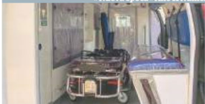
EL INTERIOR de la ambulancia militar.