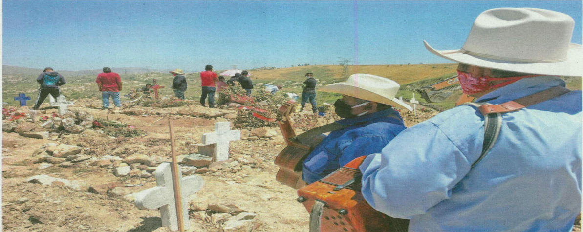
Un par de músicos se aferra a ir al cementerio a cantarle a los muertos, pues por el Covid la familia no puede hacerles un entierro normal.

OMS ESTUDIA NEXO DE VIRUS Y MAL INFANTIL ● Pide colaboración mundial para analizar la enfermedad de Kawasaki y su posible relación con el coronavirus. A14