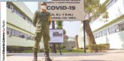
UN SOLDADO resguarda la entrada del hospital.