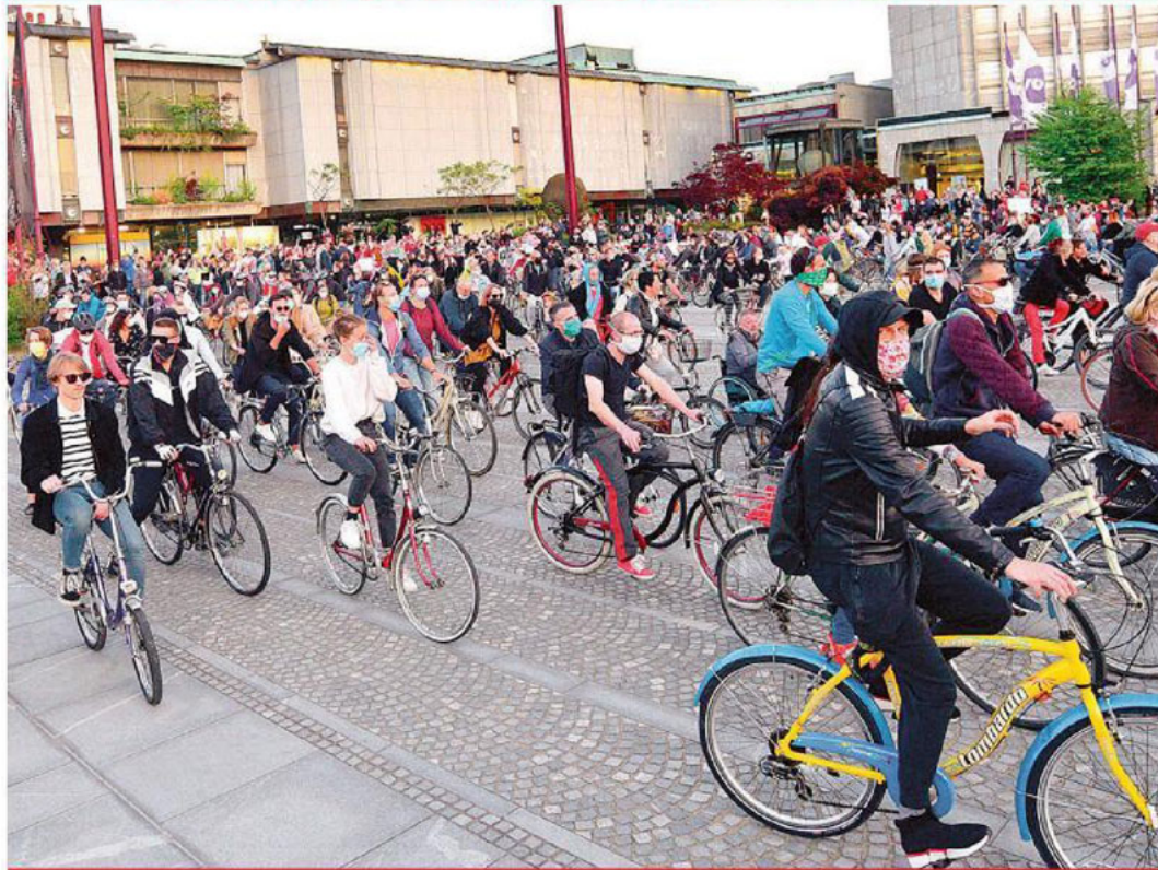
Miles de eslovenos se volcaron a las calles para festejar el levantamiento del confinamiento por el COVID, así se convierte en el primer país europeo en hacerlo. La apertura de sus fronteras se da tras registrar 1,465 casos de contagio y 103 muertes.