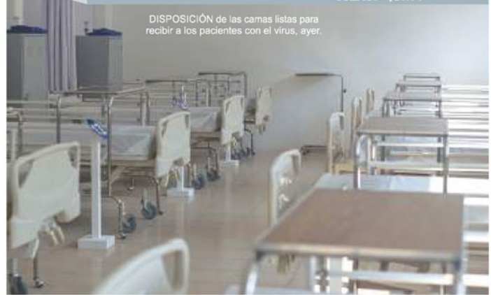
DISPOSICIÓN de las camas listas para recibir a los pacientes con el virus, ayer.