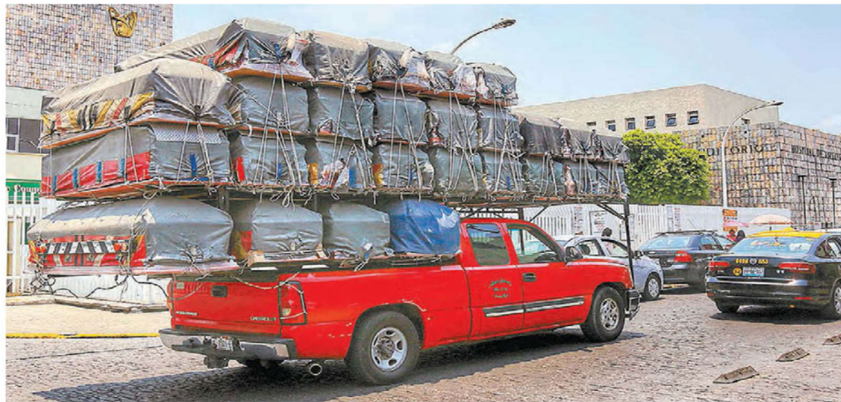
Traslado de féretros en Puebla, donde el contagio no cede y su gobernador cerró el ciclo escolar "aprobando a todos".