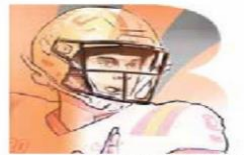
Ilustración: Horacio Sierra