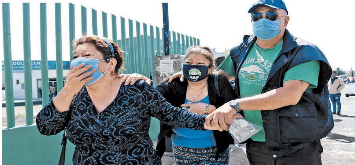
Familiares de enfermos de covid-19 en el hospital Las Américas, en Ecatepec, donde ayer hubo forcejeos con policías.