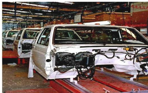
El sector automotriz es uno de los más afectados por el frenón económico del País.