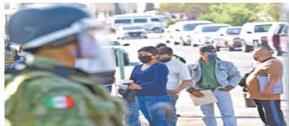
Elementos de la Guardia Nacional y de la Policía Estatal resguardaron ayer el acceso al Hospital General de Las Américas, en Ecatepec.

En su búsqueda, abrieron bolsas de cadáveres para localizarlos y confirmar los decesos. METRÓPOLI A17